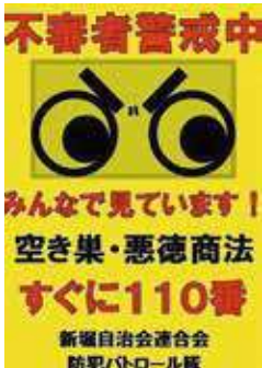
(上) 配布した防犯ポスター (下) 地域で掲示している様子