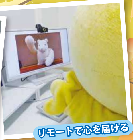
リモートで心を届ける