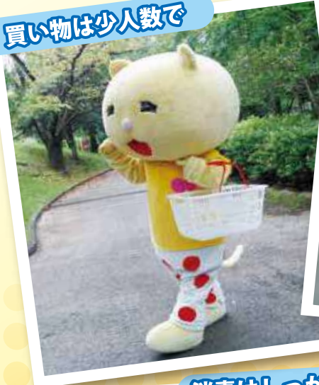
買い物は少人数で