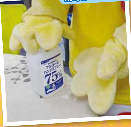
消毒はしっかりと