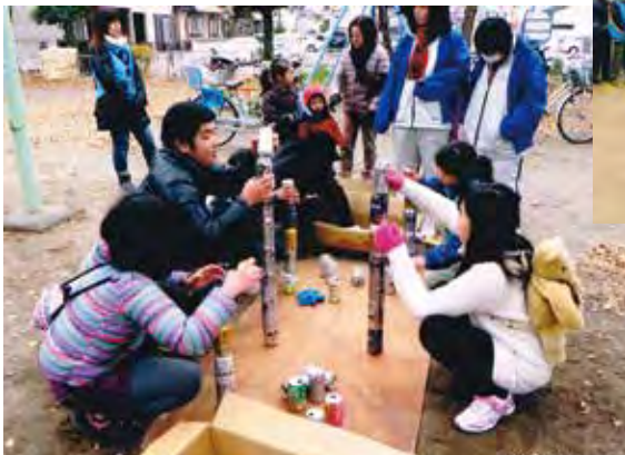
ゲームに参加の皆様