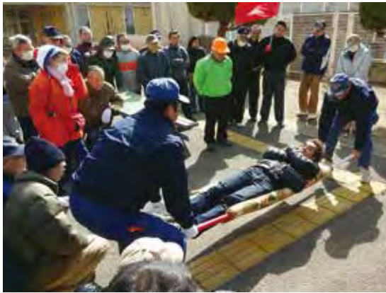
毛布で担架づくり

市内でも竜巻や大雪などの災害が発生しており、地域住民の防災への関心が高まっているように感じます。学校長は、地域の方々と全児童参加での訓練なども検討していきたいと話しております。