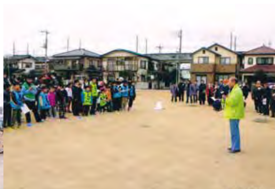
あいさつの様子 熊谷南小学校区連絡会長 荒川自治会連合会長

で、色々反省点がありますが、見直しをして、次回開催時も自治会連合会として協力していくこととしています。結びに、これからも各種団体と地域の皆様の御協力をいただき、自治会活動を進めていきたいと思っております。